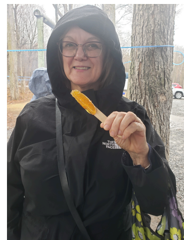
Miam, c'est sucré, et c'est bon!