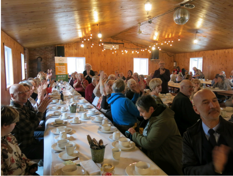
Une belle tablée! Plus de 60 personnes étaient présentes.